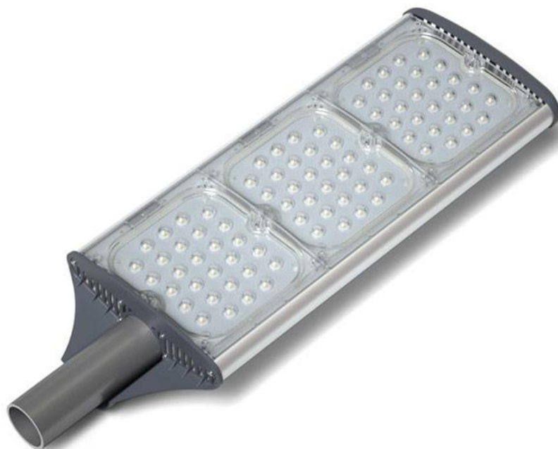
Светильник светодиодный консольный LuxON Bat

+7(495)921-45-48, www.luxon.su , info@luxon.su